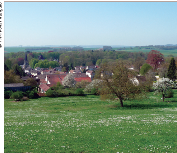
Vue sur le village de Vigny