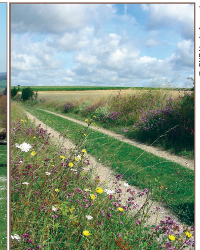
Vallée de l'Aubette