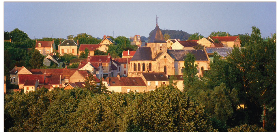
Le village d'Us