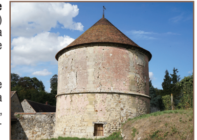
La ferme de Dampont

Du parking, aller jusqu'au bâtiment voir le panneau sur la gare et l'ancienne sucrerie ①. Rejoindre la route principale (D 66) puis prendre à droite. Traverser la Viosne, rester sur le bord de la route, puis au carrefour, traverser pour prendre à gauche la rue de la Chaussée Jules-César jusqu'à la ferme de Dampont ②.