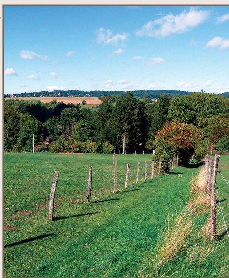
Prairies et pâtures