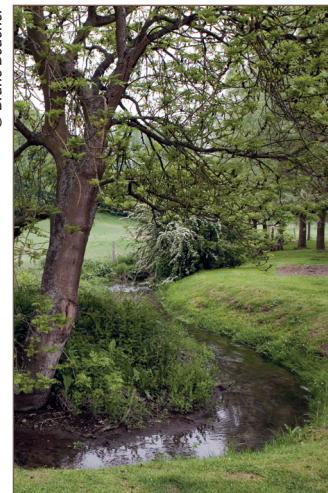
Ru de l'Eau Brillante