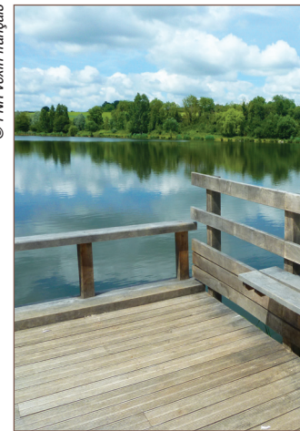
Étang de Vallière