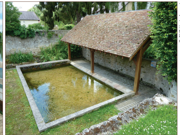
Lavoir, à Santeuil