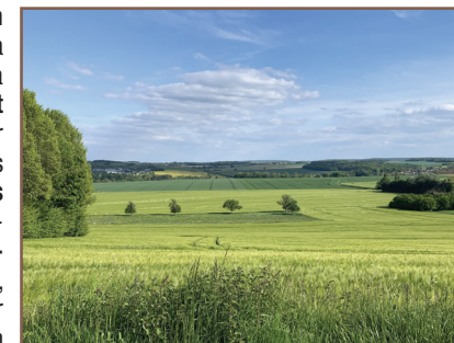
Paysage agricole près de Saint-Gervais

Du parking, emprunter la rue Fernand-Jorelle en direction du centre du village. Au carrefour, aller à droite jusqu'à l'église 1 ; se rendre sur le parvis. Laisser l'église sur la gauche et la longer jusqu'au panneau du Château Bellet 2 (en contrebas). Continuer de longer le mur pour passer derrière l'église. Au bout du chemin, prendre à droite, puis emprunter l'escalier pour arriver au niveau d'un des anciens presbytères 3. Traverser et descendre la rue Robert-Guesnier jusqu'à l'arrêt de bus et le panneau sur la chaussée Jules-César 4. Revenir quelques pas en arrière, prendre le chemin qui descend à droite de la mairie et aller jusqu'à un lavoir 5. Longer le mur du château sur environ 250 m et prendre à droite sur la D 983E.