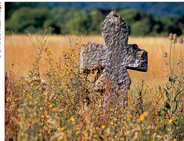
Croix des Fiches / Église Saint-Symphorien