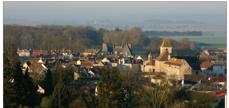
Vue générale de Marines