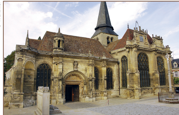
Église Notre-Dame de la Nativité

emprunter immédiatement à droite le passage Huré. Passer sous le porche et déboucher, à gauche, sur la place Potiquet où se trouve la plaque sur le cinéma 12. Gagner à droite la place de la Halle 13. Suivre la rue Carnot sur 20 m ; tourner à gauche au niveau du bar puis gagner le petit passage entre deux bâtiments. Au bout de la ruelle, monter à gauche la rue pavée jusqu'à la place d'Armes 14 et poursuivre par la rue de Paris ; passer les deux piliers 15 et rejoindre le point de départ.