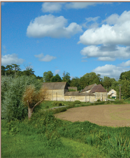
Vue sur Estrééz