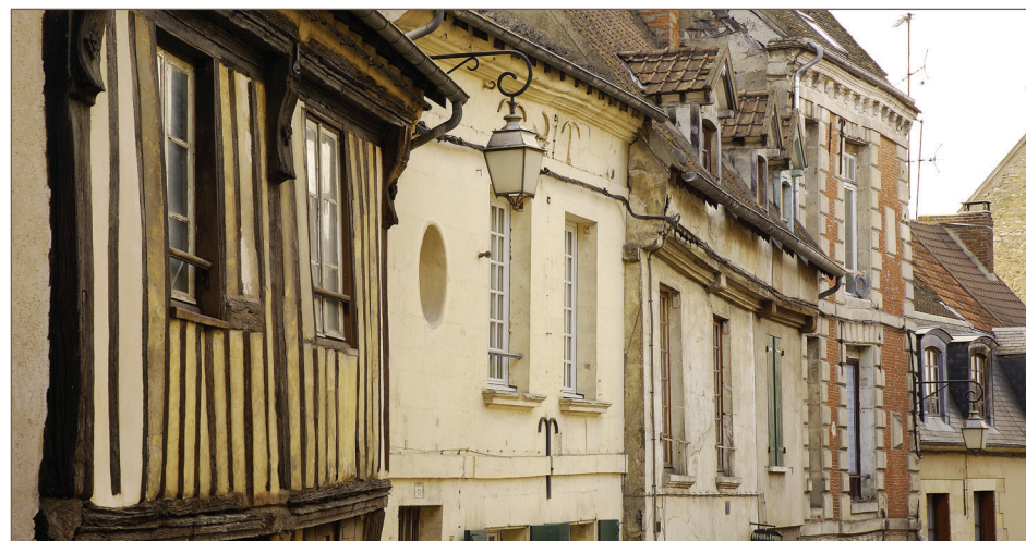
Rue de l'Hôtel-de-Ville

• hôtels particuliers et maisons médiévales • Aubette de Magny • Blamécourt • église Notre-Dame • piliers de la ville