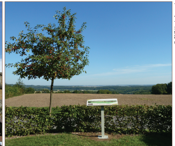
Table de lecture du paysage