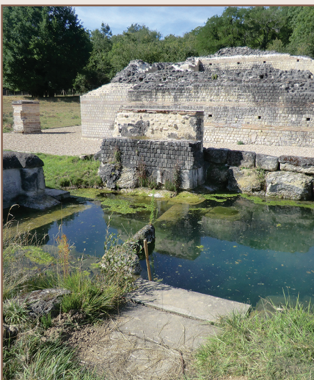
Site archéologique de Genainville

que les opérations archéologiques programmées chaque année par l'Université de Cergy-Pontoise et l'Association Etudiante Valdoisienne d'Archéologie, permettent de mieux comprendre l'histoire du sanctuaire, son organisation spatiale et architecturale mais aussi d'appréhender l'évolution des rites cultuels que pratiquaient les Gallo-Romains il y a moins de deux mille ans. Les fouilles menées depuis plusieurs décennies sur le site ont livré un important mobilier archéologique mais aussi des ex-voto , des fresques et un très beau lapidaire. Toutes ces pièces constituent le cœur des collections conservées au Musée archéologique du Val d'Oise (Guiry-en-Vexin) qui en est dépositaire.