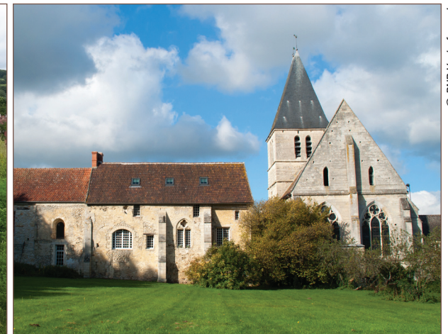
Église et prieuré de Genainville