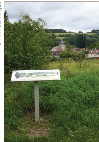
Point de vue sur le village