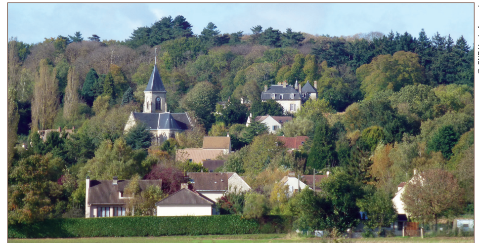
Le village de Frémainville