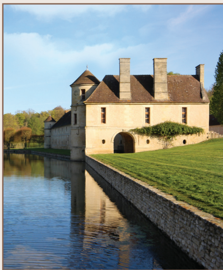
Domaine de Villarceaux