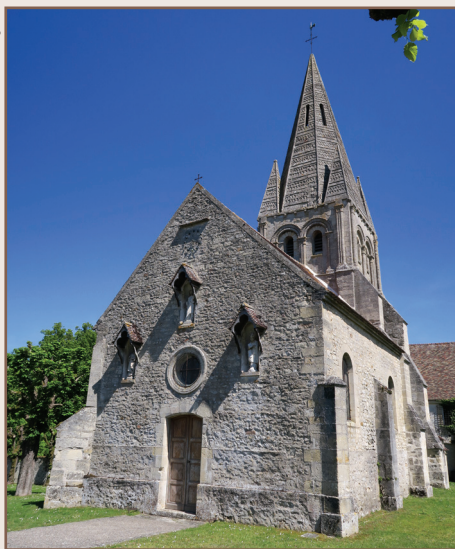
Église de Gadancourt

aux époques gallo-romaine et mérovingienne, c'est surtout à partir du XIII e siècle que le village se développe, d'abord au sud autour de l'église, puis vers le nord autour des grands corps de fermes et du hameau de Chantereine. Ceinturant le village au nord, l'ancienne voie de chemin de fer oriente, au XIX e siècle, son développement d'est en ouest. Avernès présente un patrimoine bâti assez diversifié, comptant de nombreux bâtiments liés à l'agriculture, mais aussi des maisons de bourg ou de notable à l'architecture plus recherchée. La pierre calcaire et les enduits au plâtre confèrent au village une ambiance très minérale.