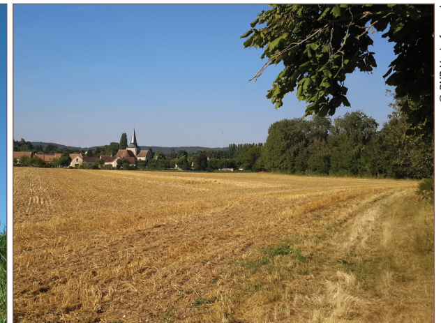
Vue sur Avernes